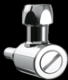
Innesto RUBINETTO FILTRO