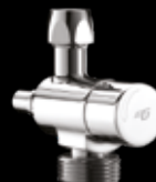
Innesto sottolavabo combinato con rubinetto per lavastoviglie/lavatrice